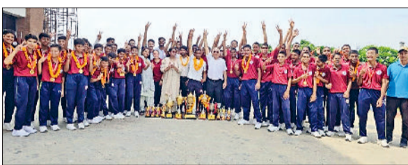
फतेहाबाद। नेशनल गेम्स में विजेता सैनिक स्कूल खारा खेड़ी के खिलाड़ी।

ऑल इंडिया सैनिक स्कूल नेशनल गेम्स ग्रुप ए का आयोजन सैनिक स्कूल कपूरथला में किया गया। इसमें सात सैनिक स्कूलों ने हिस्सा लिया जिनमें चार पुराने सैनिक स्कूल कुंजपुरा, कपूरथला, नगरोटा एवं सुजानपुर टीआर और तीन नए सैनिक स्कूल खारा खेड़ी, नाभा एवं नालावाड़ शामिल थे। इन खेलों में एथलेटिक्स, वॉलीबॉल और बास्केटबॉल के जूनियर एवं सब जूनियर लड़के एवं लड़कियों के मुकाबले हुए। इनके अतिरिक्त सभी प्रतिभागियों को अपने स्कूल की तरफ से एक सांस्कृतिक कार्यक्रम भी प्रस्तुत करना था जिसके लिए