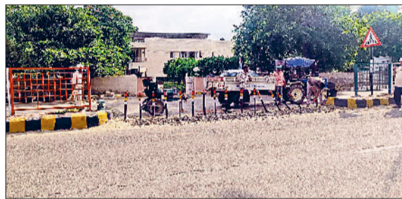
फतेहाबाद। रैस्ट हाऊस को जाने वाली बंद की गई क्रॉसिंग व रैस्ट हाऊस को सामने ठेकेदार द्वारा बंद करवाई जा रही क्रॉसिंग।