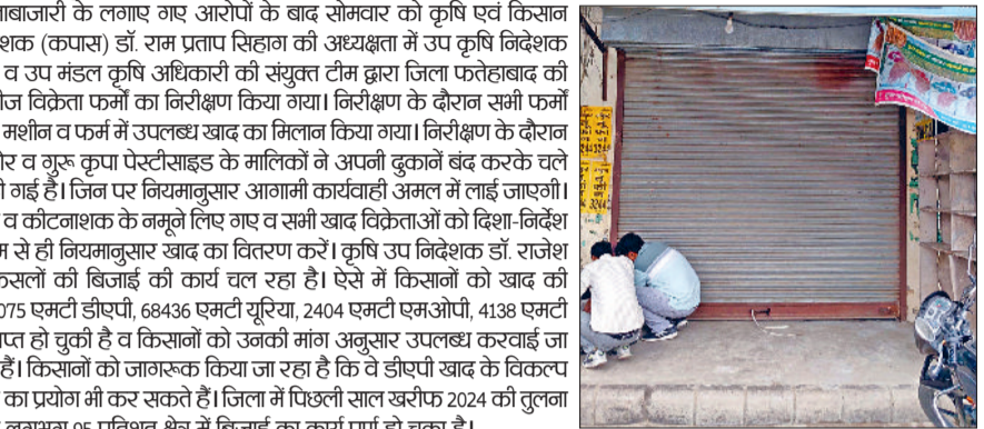
कालाबाजारी के आरोपों के बाद कृषि अधिकारी उतरे फ़िल्ड में, दो दुकानदार दुकानें बंद हुए फरार, दुकानें सील