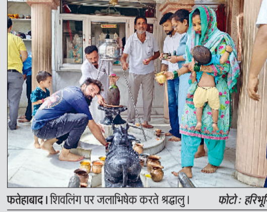
फतेहाबाद। शिवलिंग पर जलाभिषेक करते श्रद्धालु।

जल, दूध, शहद चढ़ाकर भगवान शिव को किया प्रसन्न