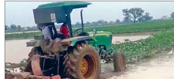
सिरसा। सेमग्राम क्षेत्र में जलभराव से नरमा की फसल पर ट्रैक्टर चलाते किसान।

नाथसूरी चोपटा खंड के सेम से प्रभावित सात गांवों की करीब दो हजार एकड़ नरमा, ग्वार, मूंगफली की फसलों में बरसाती व सेम का पानी भरने से किसानों को नरमे की फसल को जोतने के लिए मजबूर होना पड़ रहा है। बारिश के कारण नरमे की फसल सहित दूसरी फसलों को भी बेहद नुकसान हुआ है। किसानों ने सरकार से आर्थिक मदद