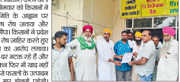
किसान संघर्ष समिति ने एसडीएम कार्यालय में अधिकारियों को मुख्यमंत्री के नाम मांग पत्र सौंपकर इन समस्याओं का जल्द समाधान करने की मांग की।

कालाबाजारी। डीएपी व यूरिया खाद की कालाबाजारी करने वालों पर सख्त कार्रवाई की मांग को लेकर सोमवार को किसानों ने पगड़ी संभाल जट्टा किसान संघर्ष समिति के आह्वान पर कालाबाजारी करने वालों को शह देने का आरोप लगाया। किसानों को मुख्यमंत्री के नाम ज्ञापन सौंपा। किसानों ने प्रदेश सरकार और जिला प्रशासन के खिलाफ रोष जाहिर करते हुए कालाबाजारी करने वालों को शह देने का आरोप लगाया। किसानों ने कहा कि वे खाद के लिए दर-दर भटक रहे हैं और लंबी लाइनों में लगने को मजबूर हैं, लेकिन फिर भी खाद नहीं मिल पा रही है। समय पर खाद न मिलने से फसलों के उत्पादन में असर पड़ेगा, जिससे उन्हें दोहरी मार झेलनी पड़ेगी। किसान संघर्ष समिति ने एसडीएम कार्यालय में अधिकारियों को मुख्यमंत्री के नाम मांग पत्र सौंपकर इन समस्याओं का जल्द समाधान करने की मांग की। किसानों ने कहा कि स्वयं को किसान हितैषी होने का दावा करने वाली प्रदेश की भाजपा सरकार हाथ पर हाथ रखकर बैठी हुई है। न तो सरकार खाद की कालाबाजारी रोक पा रही है और न ही खाद की कमी को दूर कर पाई है। व्यापारी मनमानी कर रहे हैं और डीएपी और यूरिया देने के नाम पर दूसरी वस्तुएं जबरदस्ती थोपकर किसानों को लूटा जा रहा है। मांग पत्र में किसानों ने कहा है कि डीएपी व यूरिया खाद की कालाबाजारी पर रोक लगाई जाए और इसकी उपलब्धता सुनिश्चित की जाए। बिजली के बंदे हुए रेट वापस लिए जाएं और स्मार्ट मीटर लगाने पर रोक लगाई जाए। नहरों में दो सप्ताह पानी छोड़ा जाए।