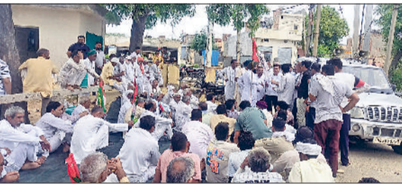
भूना। बिजली समस्याओं को लेकर धरना देकर विरोध करते हुए किसान।