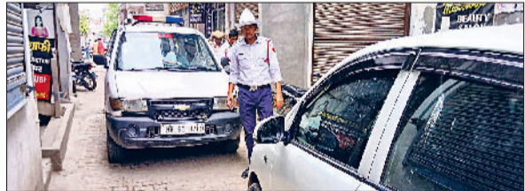
रतिया। गली के बीच में खड़ी गाड़ी के कारण फंसी ट्रैफिक पुलिस की गाड़ी।

शहर के मेन बाजार से लेकर टोहाना रोड को जाने वाली प्रमुख गली में आज एक कर चालक गली के बीच में गाड़ी खड़ी करके खरीदारी करने चला गया, जिससे आने जाने वाले का रास्ता अवरुद्ध हो गया। इसी दौरान जब ट्रैफिक पुलिस इंचार्ज की गाड़ी वहां से गली में से गुजर रही थी तो रास्ता बंद होने के कारण ट्रैफिक पुलिस के इंचार्ज की गाड़ी भी गली में